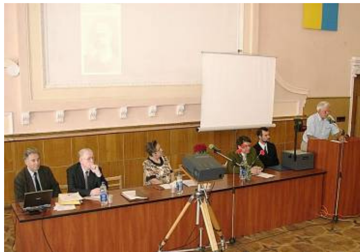
На открытии конференции

Однако творчество академика Вернадского значительно шире формальных научных рамок, из которых оно вырывается к проблемам художественного, философского, религиозного и общественно-политического характера. Изучение наследия В.И. Вернадского в старейшем в Донбассе политехническом вузе, но молодом национальном университете, будет способствовать поднятию уровня профессиональной, фундаментальной и гуманитарной подготовки наших выпускников и стимулировать активный творческий научный поиск преподавателей, научных сотрудников, аспирантов, магистрантов и студентов.